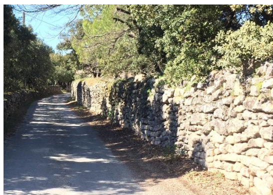
Illustration du patrimoine lithique présents sur la commune